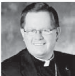
Mgr Gérald Cyprien Lacroix