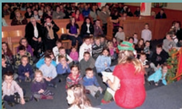
Une première célébration de la Parole avec les jeunes à La Baie aura des suites dans les paroisses durant le Carême.