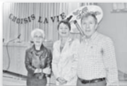
Les trois panélistes