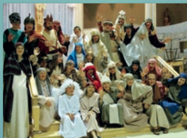
La troupe de théâtre formée en partie de jeunes qui se préparent pour la JMJ de Madrid à l'été 2011 a parcouru la région durant l'automne avec un spectacle fort apprécié.

Le texte intégral des vœux de Mgr Rivest est inséré en annexe à la présente parution.