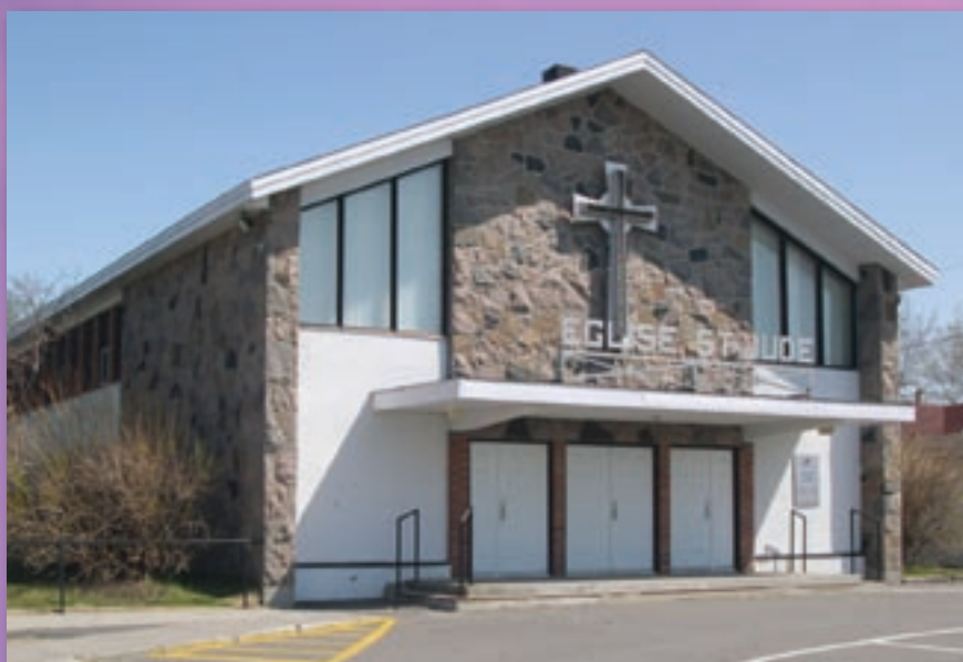
Vente de l'église St-Jude (page 8)